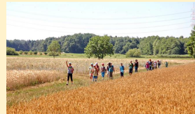
Ein Wander- und Studientag der Lessingschüler

Der Rundweg lädt Spaziergänger und Radfahrer zum Kennenlernen der Feldflur und der näheren Umgebung von Erzhausen ein. Er besteht aus dem westlichen Halbmond, der 6,0 km (Spaziergänger) und 4,8 km (Radfahrer) lang ist und dem östlichen Halbmond von 5,2 km Länge. Eine Nord-Süd-Spange quert den alten Ortskern. Sie misst 1,9 Kilometer.