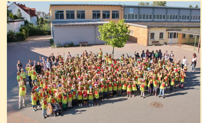
24.6.2014 Im Schulhof Gruppenfoto vor der Wanderung